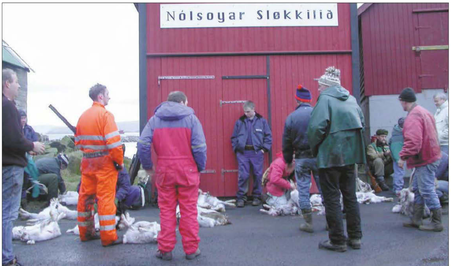
Afturkommir av haruveiði í fjør loysa menn byrðarnar av sær uttanfyri brandstøðina – sum vanligt er.