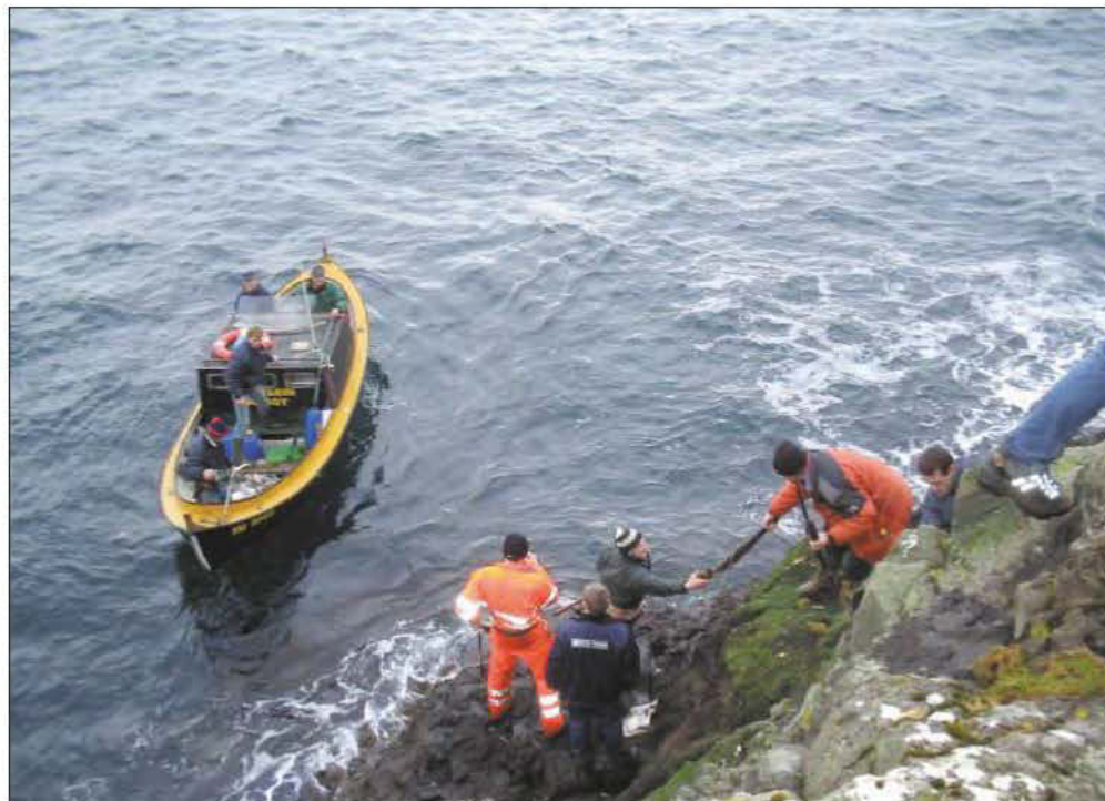
Onkur hevði fingið tað snilda hugskot at sigla av Hósmøl suður á Borðuna. Og tað kom væl við hjá teimum beindovnu. (Mynd: Jákup av Skarði 2003)

Komnir út um Garðar verður aftur tingast um, hvør skal fara upp á oynna og hvussu nógvir. Eitt passaligt tal verður semja um, og teir, ið eru raskari til beinini fara so turnandi avstað. Vit aðrir