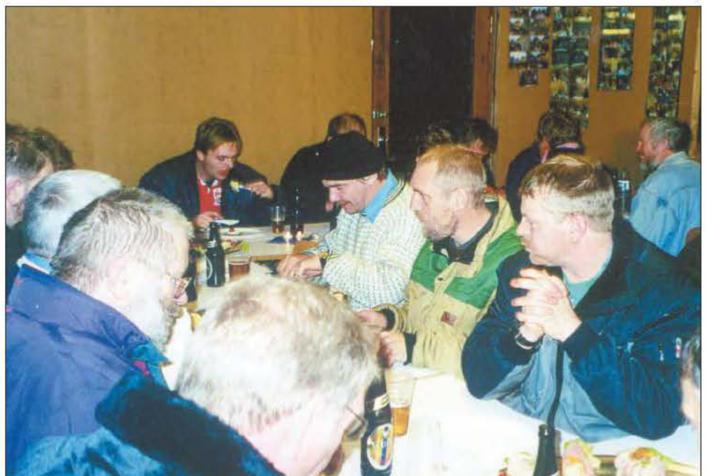
Einki er sum ábitið aftaná. Her høvundurin mitt á myndini í troyggju og við kalli á skalla – ikki serliga vælvant.

Sum vant fekst hon eisini frá hondini, og menn kundu í klikek skinkla runt í ymisk hús. Reyppið mundi ikki vera tað minsta, nú ein slíkur rimmardagur var um at gerast søga. Eitt var tó ein troyst. Vit vita, at um eitt ár, so verður harudagur aftur í Nólsoy.