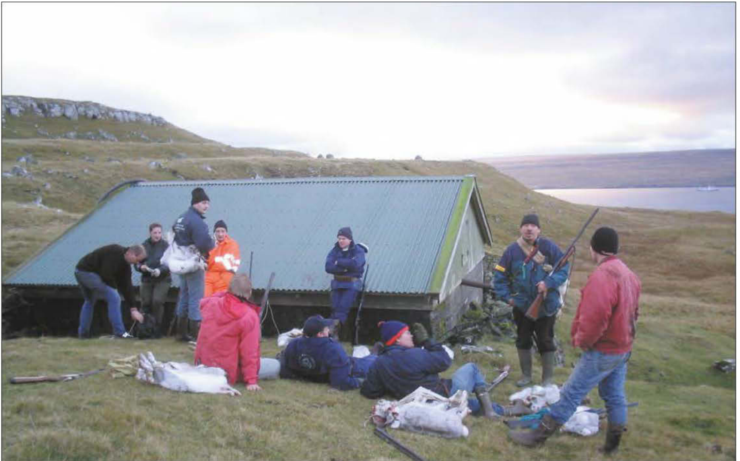
Menn hvíla seg við ovára bassengið á veg til húsar aftur.

at talan er ikki um nakra kapprenning, so tað varar ikki leingi, áðrenn eg verði noyddur at skáka undanbrekku, til eg at enda klári at halda meg uppi á Longubrekku heimeftir.