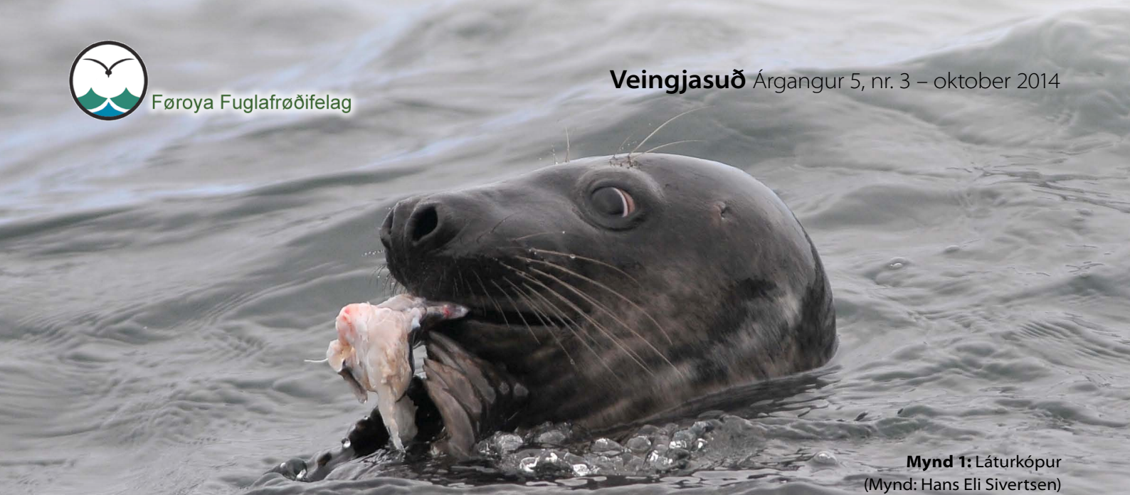
Mynd 1: Láturkópur