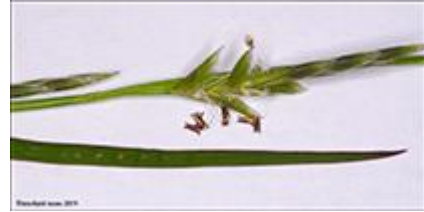
Sevkendur kveiki Elymus farctus