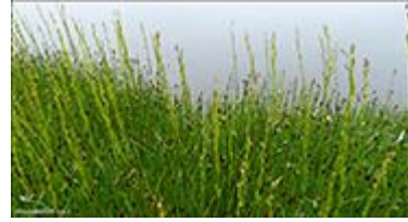
Strandarseyðaleykur Triglochin maritima