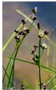
Ósasev Juncus alpinoarticulatus subsp. rariflorus