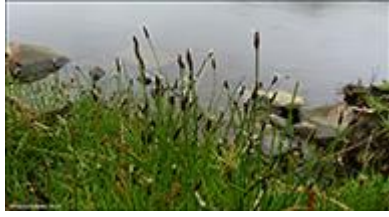
Fáblømt mýrstrá Eleocharis quinqueflora