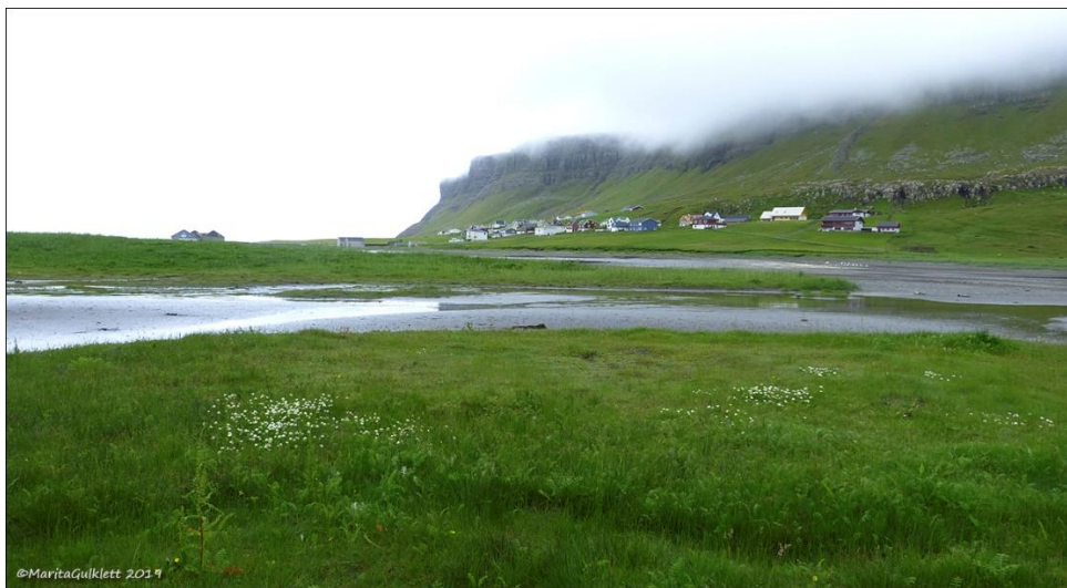
Nes, Hvalba 22.07.2019