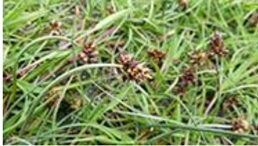
Bogin stør Carex maritima