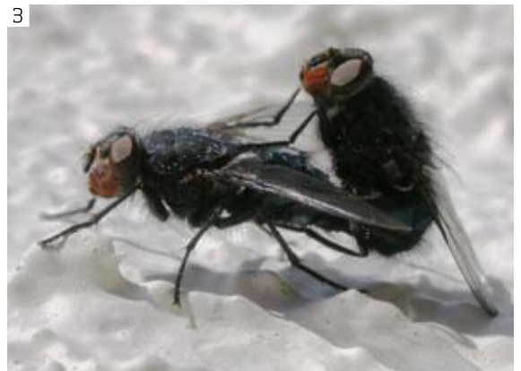
3 Vanligar skinflugur Calliphora vicina